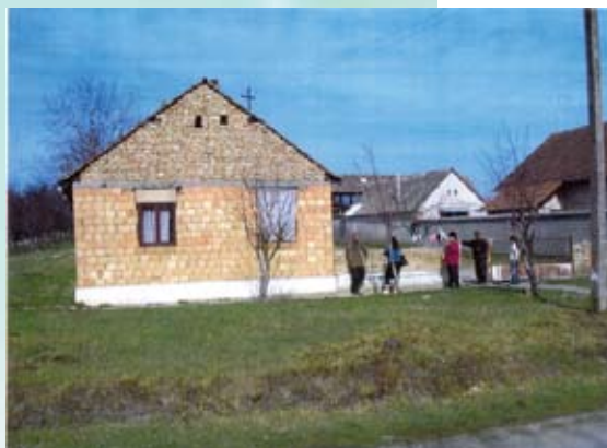
Kuća porodice Korolija